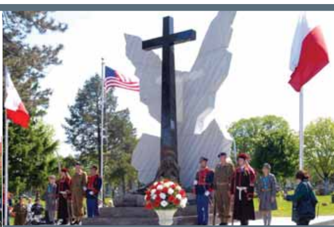
Pomnik Katyński podczas obchodów Memorial Day

Uroczystości z okazji Memorial Day przy Pomniku Katyńskim na cmentarzu św. Wojciecha w Niles, koło Chicago. 25 maja 2009.